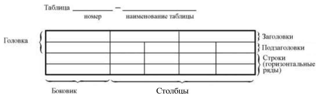
Рисунок 5.2 – Пример оформления таблицы

Пример оформления таблицы приведен на рисунке 5.2.