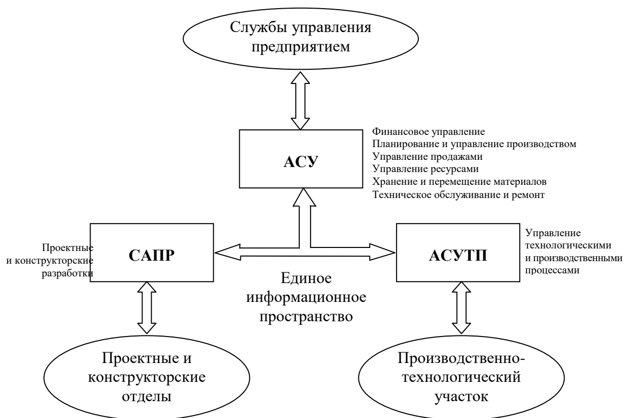
Рисунок 3.1 – Информационное пространство предприятия: АСУ – автоматизированная система управления; САПР – система автоматизированного проектирования; АСУ ТП – автоматизированная система управления технологическим процессом