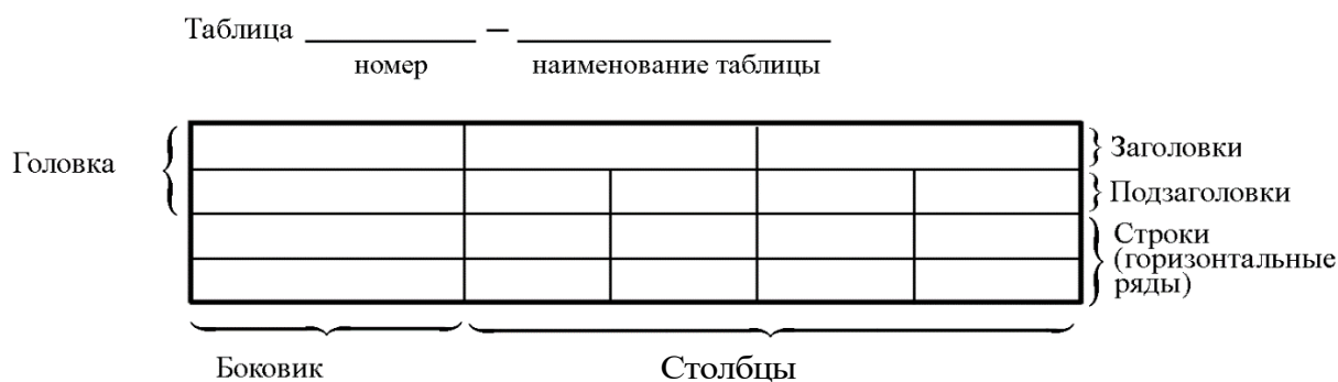
Рисунок 3.2 – Пример оформления таблицы

Пример оформления таблицы приведен на рисунке 3.2.