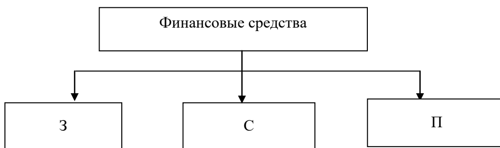
Рисунок 3.1 – Виды финансовых средств: З – заемные; С – собственные; П – привлеченные